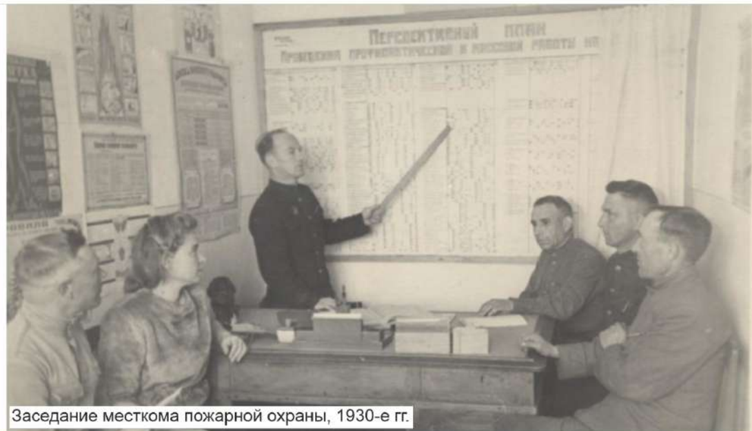
Заседание месткома пожарной охраны, 1930-е гг.