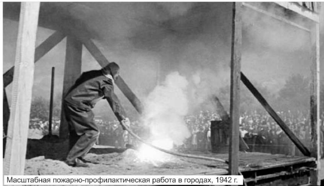
Масштабная пожарно-профилактическая работа в городах, 1942 г.