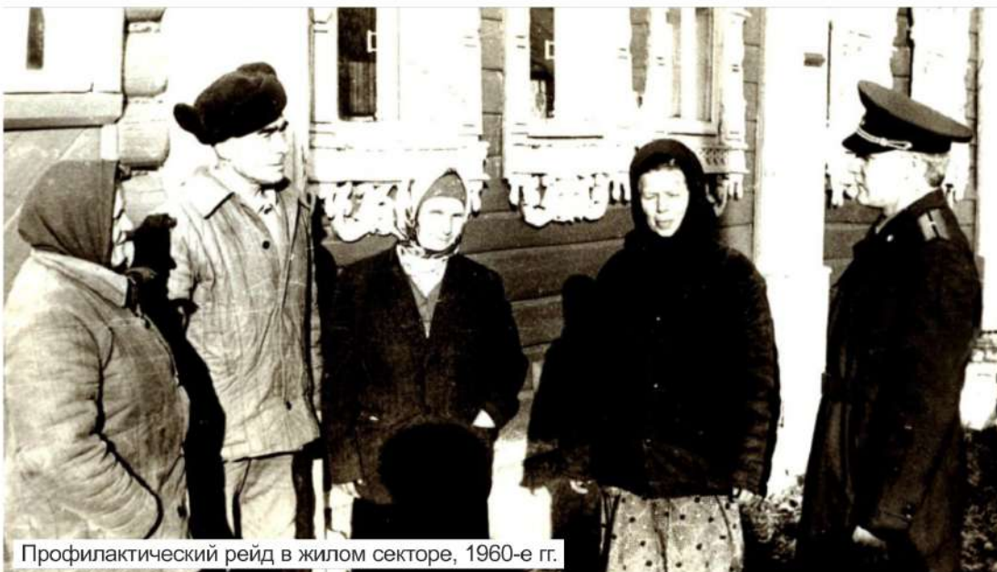
Профилактический рейд в жилом секторе, 1960-е гг.