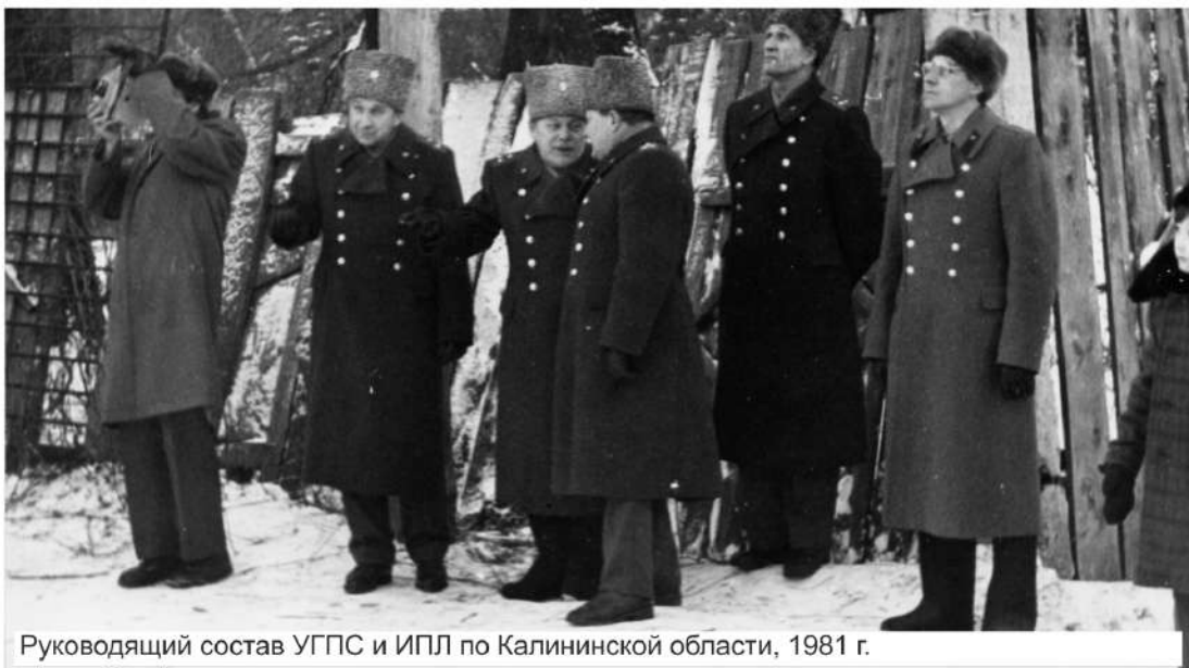
Руководящий состав УГПС и ИПЛ по Калининской области, 1981 г.