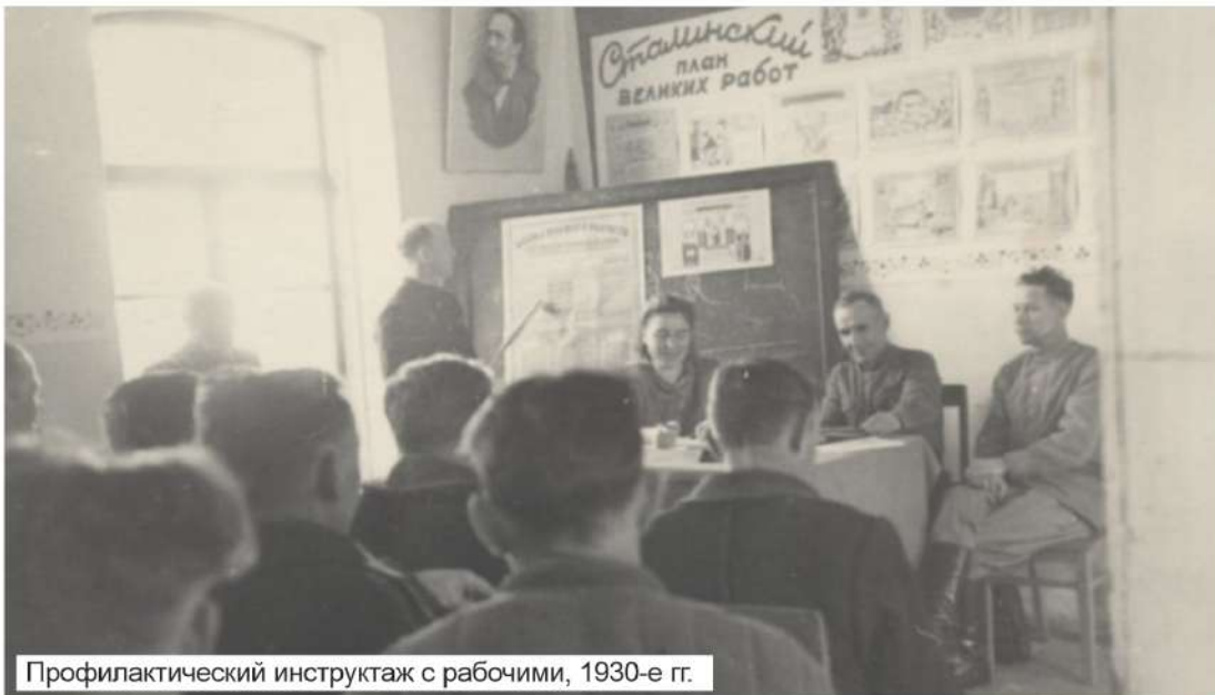
Профилактический инструктаж с рабочими, 1930-е гг.