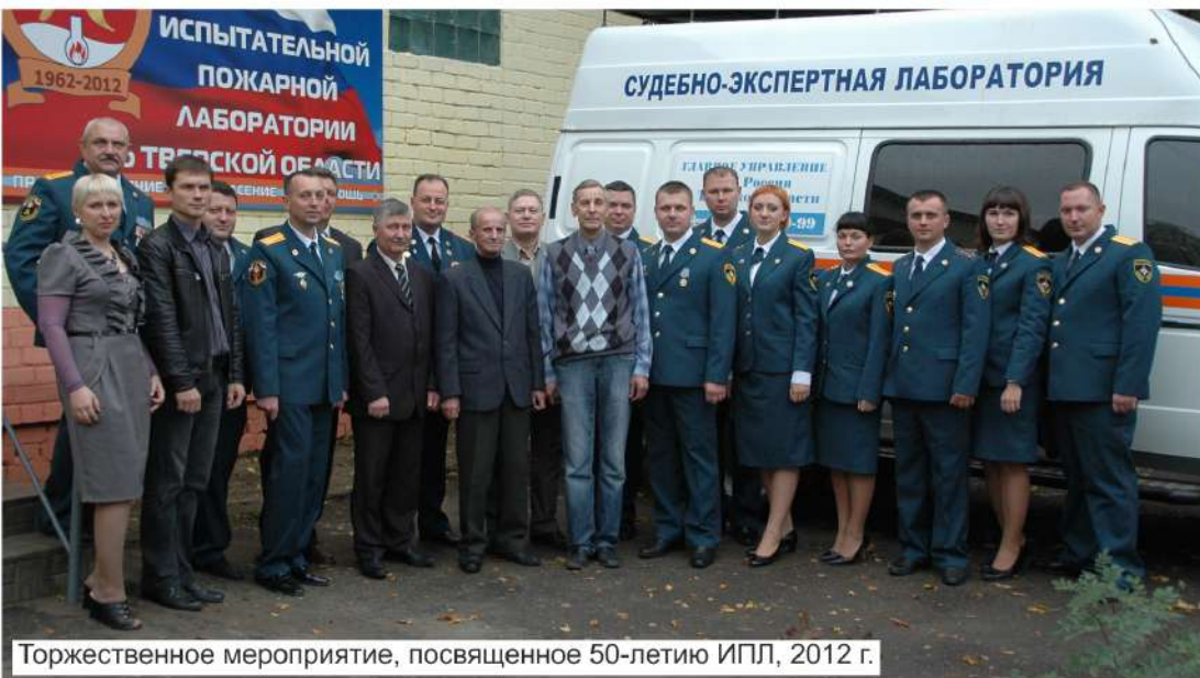
Торжественное мероприятие, посвященное 50-летию ИПЛ, 2012 г.