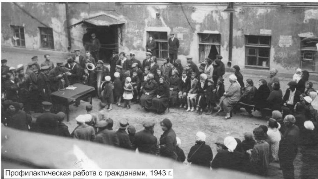
Профилактическая работа с гражданами, 1943 г.