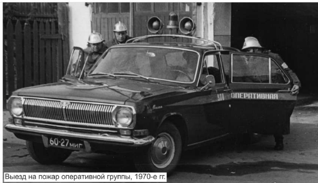
Выезд на пожар оперативной группы, 1970-е гг.