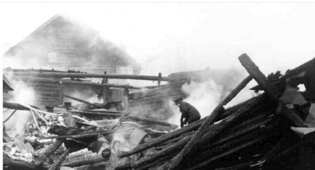
Обследование на месте пожара в складе Лихославльторга, г. Лихославль, 14 апреля 1990 г.