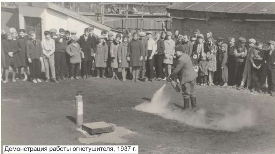
Демонстрация работы огнетушителя, 1937 г.