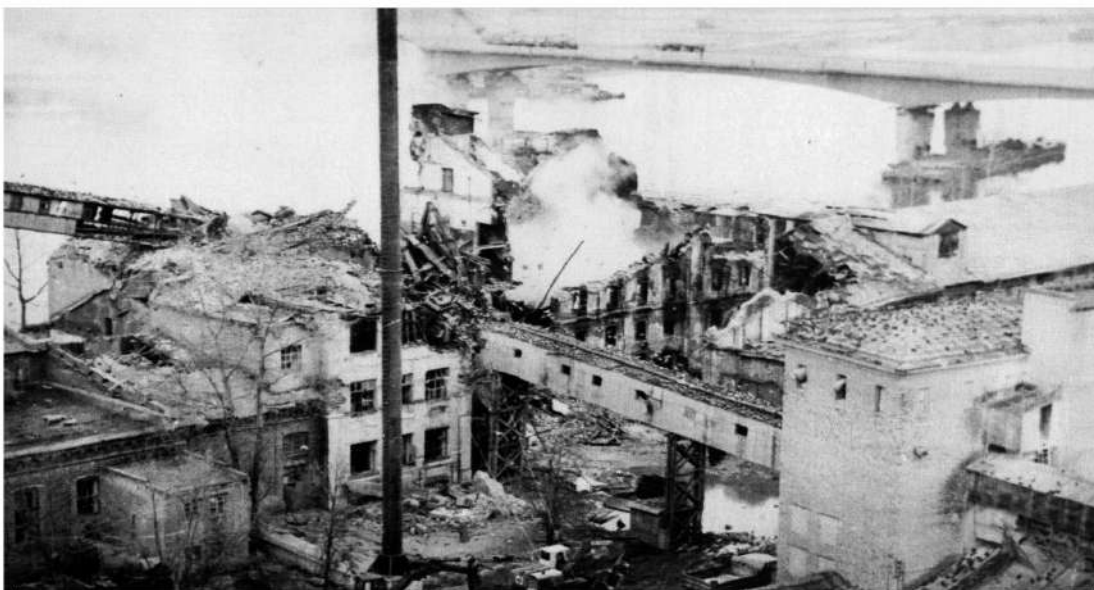
Обследование и разбор последствий взрыва на Мелькомбинате г. Калинин, 10 ноября 1981 г.