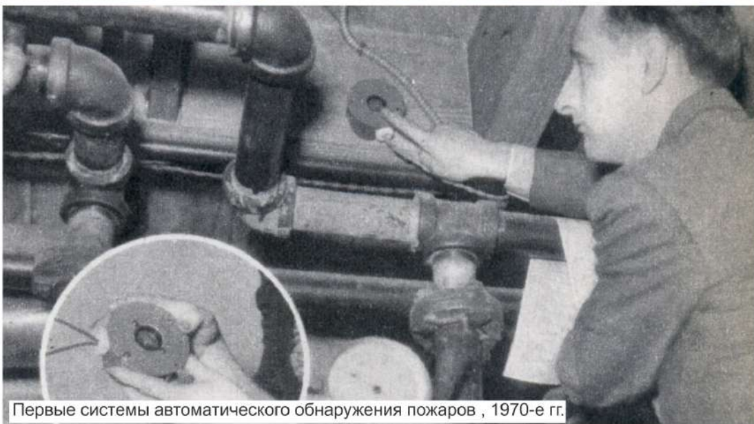
Первые системы автоматического обнаружения пожаров, 1970-е гг.