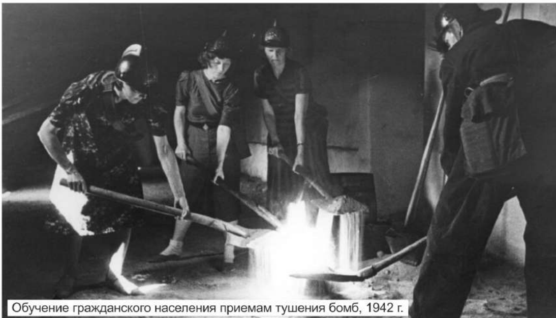
Обучение гражданского населения приемам тушения бомб, 1942 г.